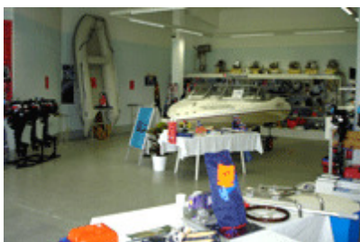
Ausstellung von Schlauchbooten, Motorbooten und Motoren