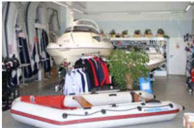
Unser Zubehör- und Wassersport Shop in Dresden Heidenau